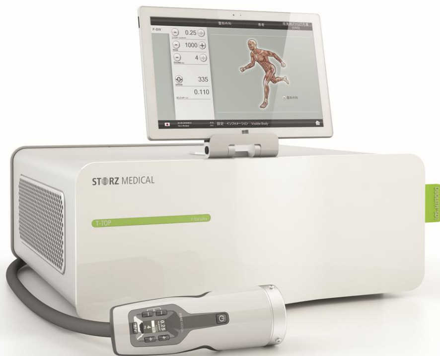
集束型 SHOCK WAVE DUOLITH SD1 T-TOP ultra (デュオリス SD1 ウルトラ)